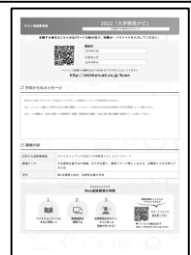
生徒用受講の手引き